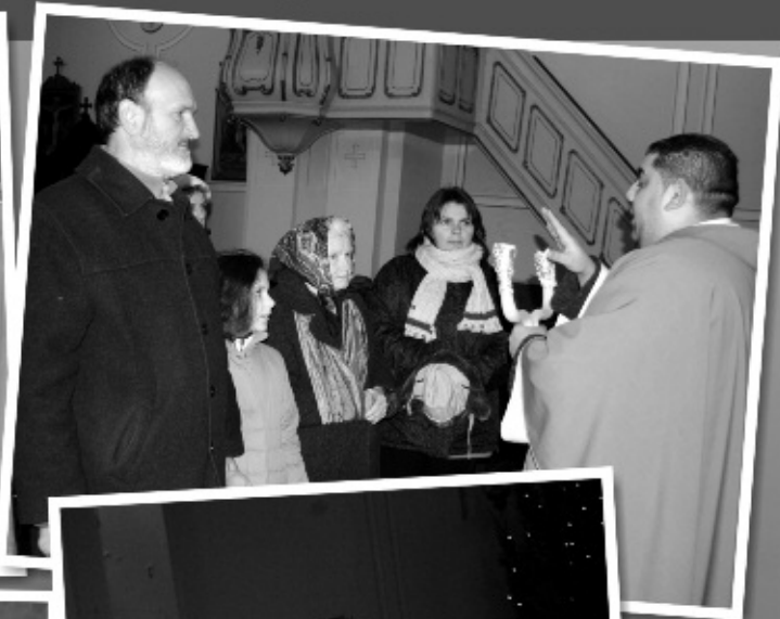
Házszentelés a plébánián, vízszentelés a templomban