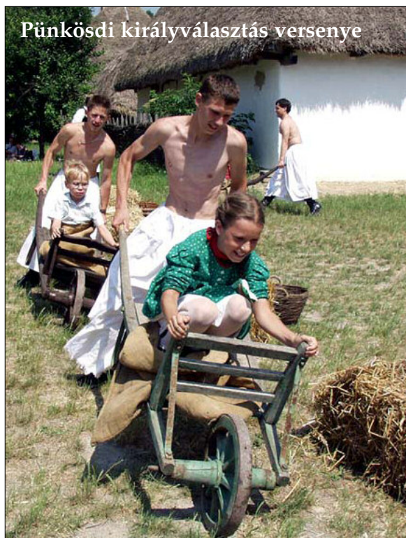
Pünkösdi királyválasztás verseny

vaszköszöntés, a pünkösdi királynéjárás, amelyben a kislányok vesznek részt, és a faluköszöntés=pünkösdlés, amelyben kislányok és kisfiúk is közreműködtek. Mivel pünkösdtől megint lehetett lakodalmakat rendezni, és a tavasz-