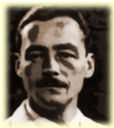
WASS ALBERT (1908 - 1998)